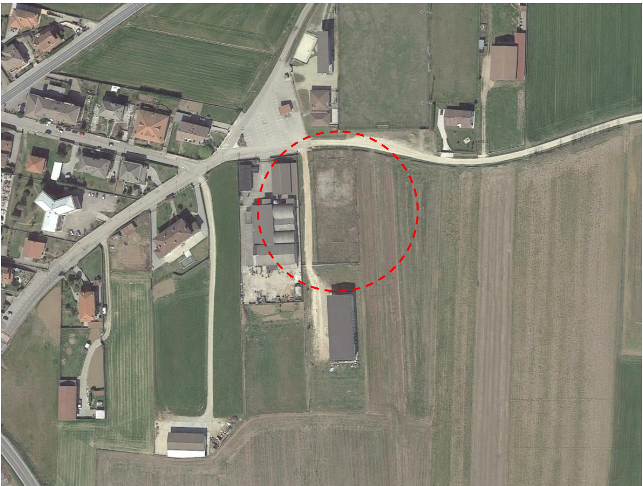
Ortofoto Area di intervento