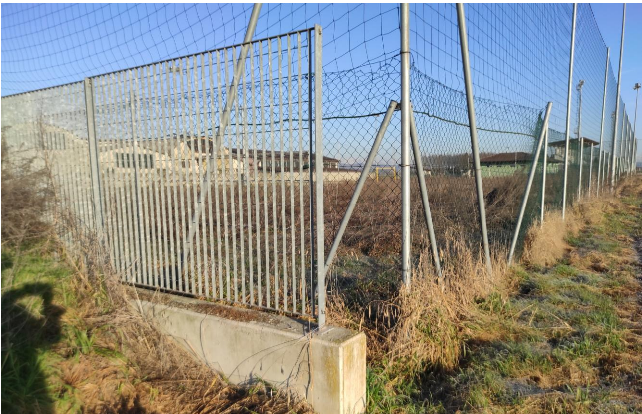
Documentazione fotografica sopralluogo – Vista della recinzione esistente