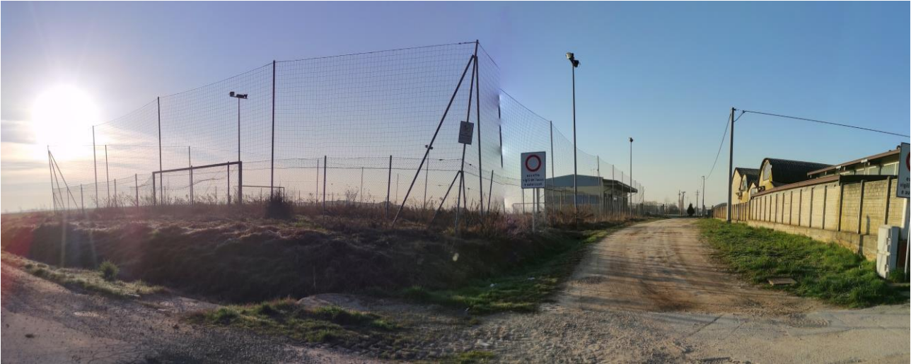
Documentazione fotografica sopralluogo – Vista dalla Strada del Vernante