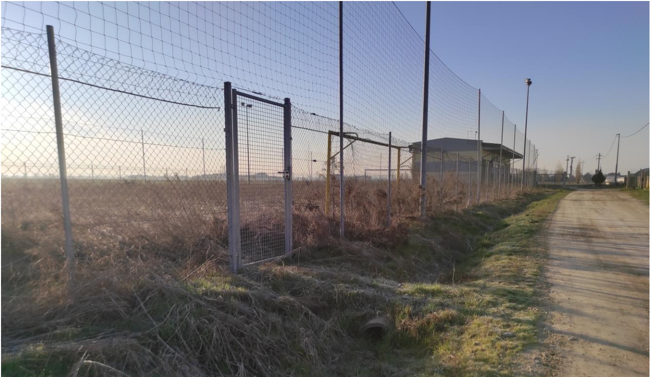
Documentazione fotografica sopralluogo – Vista accesso esistente