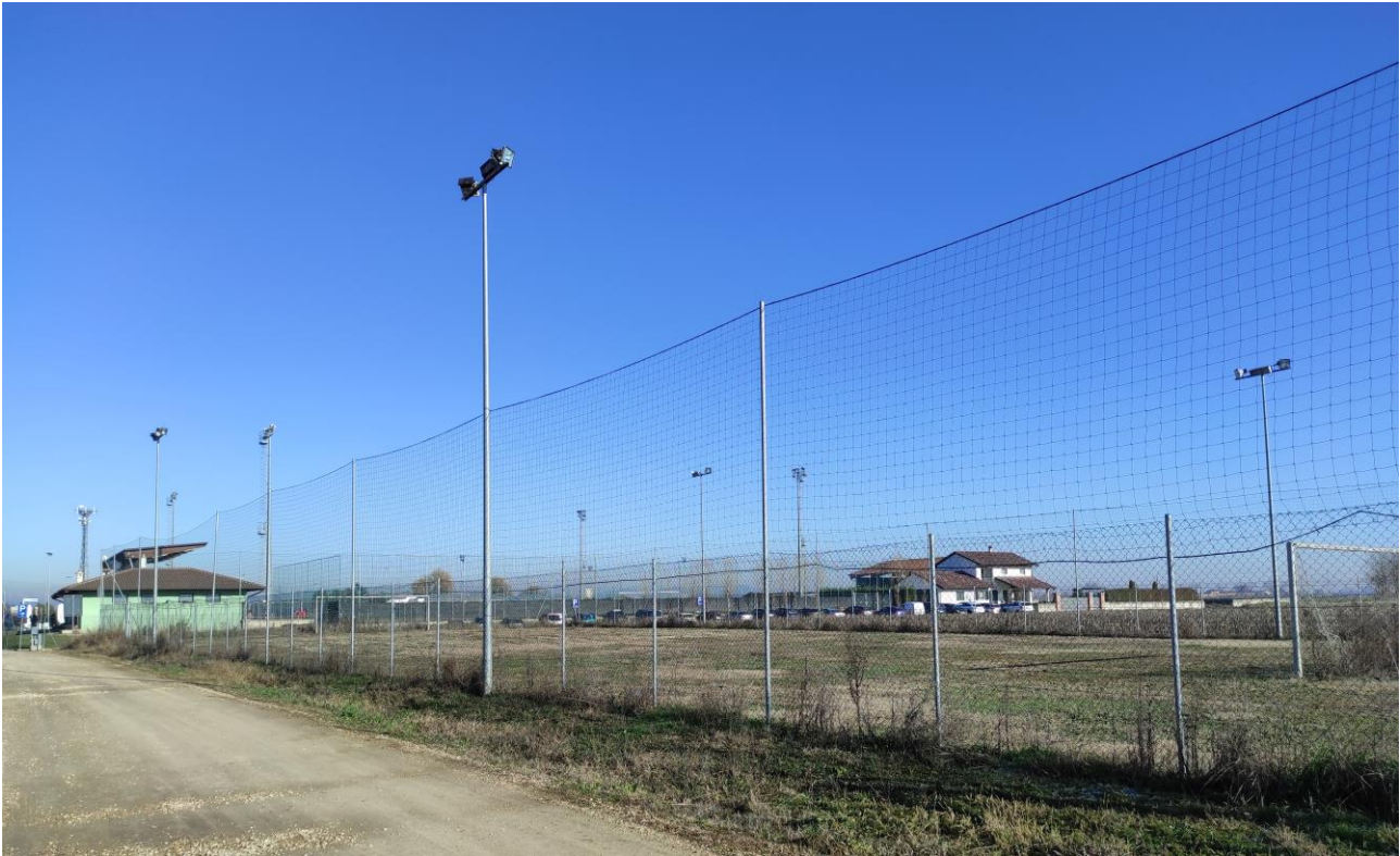
Documentazione fotografica sopralluogo – Vista dall'accesso esistente