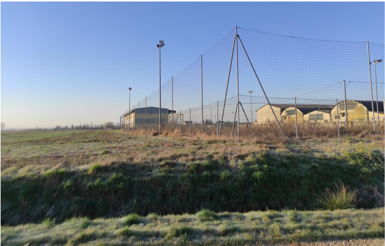
Documentazione fotografica sopralluogo – Vista dalla Strada del Vernante