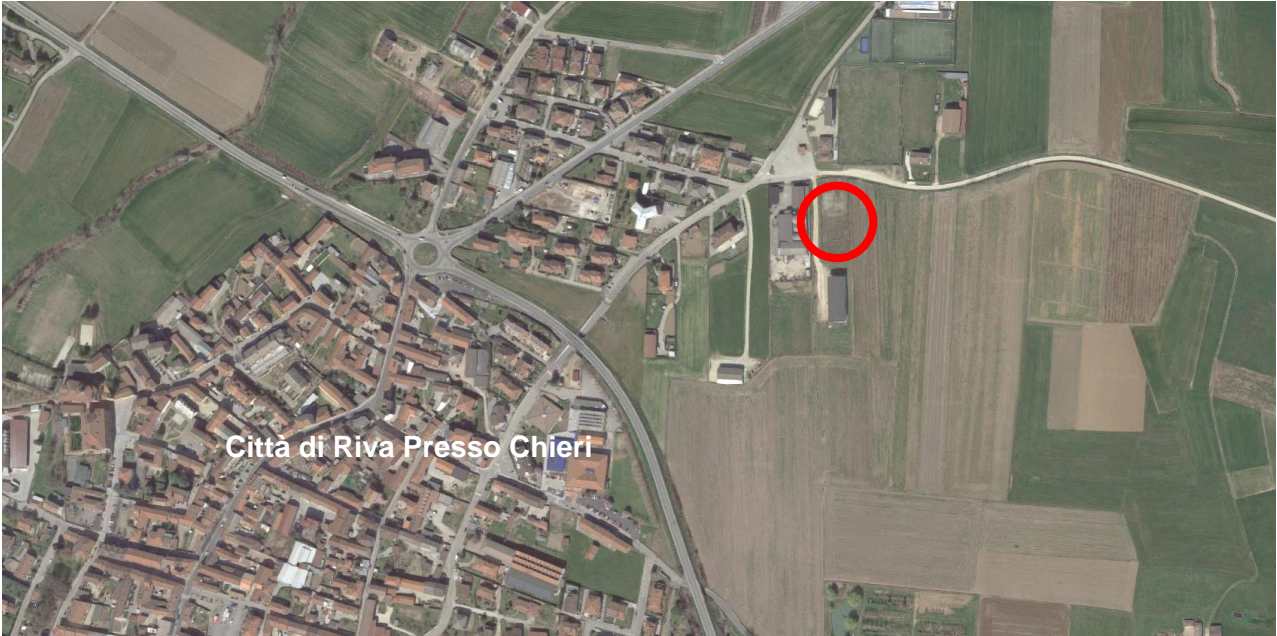
Ortofoto Città di Riva Presso Chieri