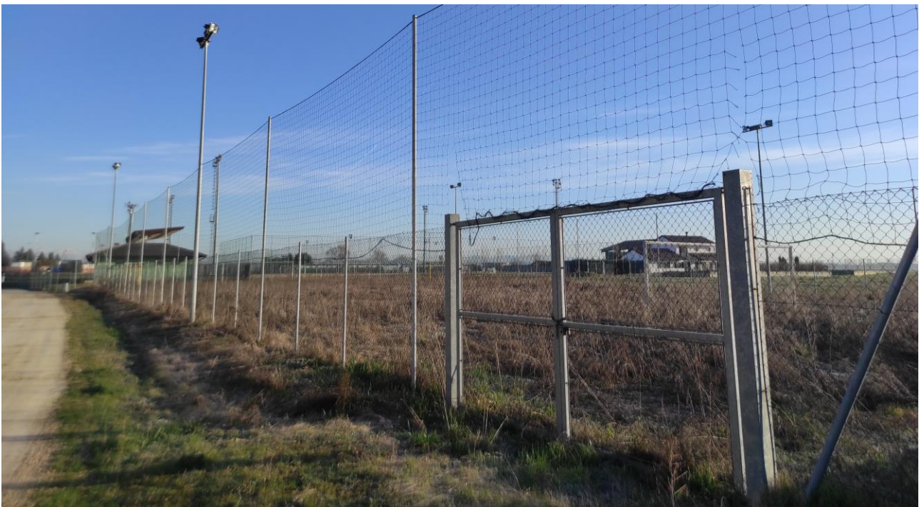
Documentazione fotografica sopralluogo – Vista accesso esistente